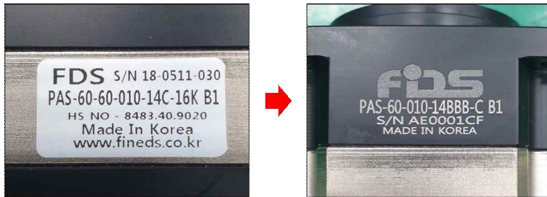
기존: 라벨 썸